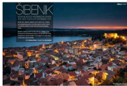
The Guardian, Mirror, Croatia Airlines...