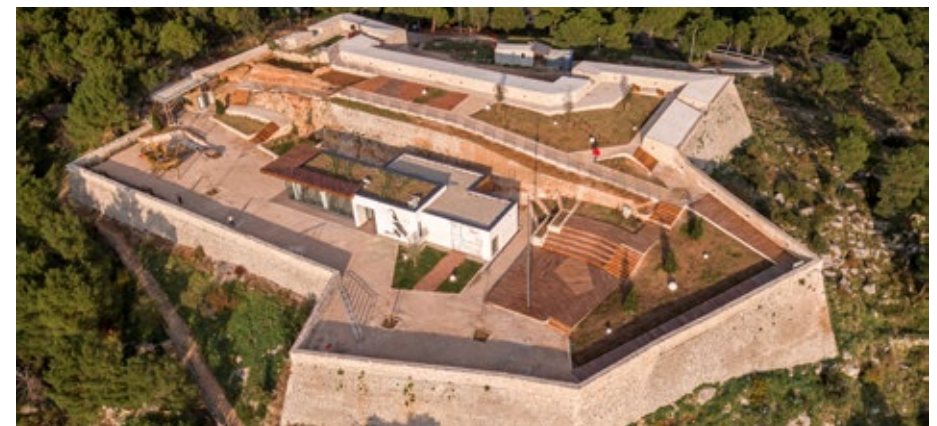
Uspješno smo obnovili tvrđave sv. Mihovila i Barone koje ostvaruju rekordnu posjećenost. Osnovali smo ustanovu Tvrđava kulture Šibenik.