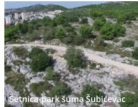
Šetnica-park šuma Šubičevac