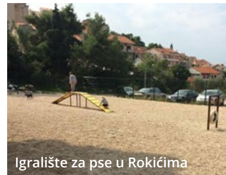
Igralište za pse u Rokićima