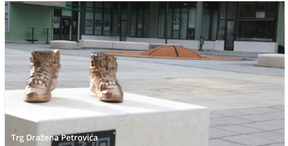
Trg Dražena Petrovića