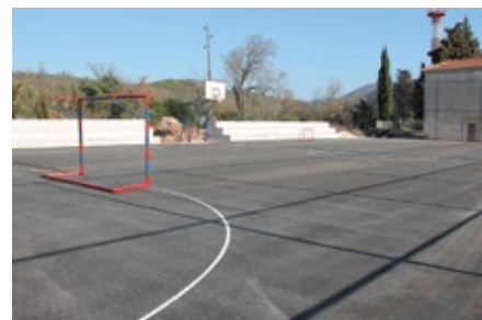
Obnovili smo sportsko igralište u Boraji.

Financirali smo polaganje terena s umjetnom travom na Šubičevcu te je uređen Sportski centar Ljubica.