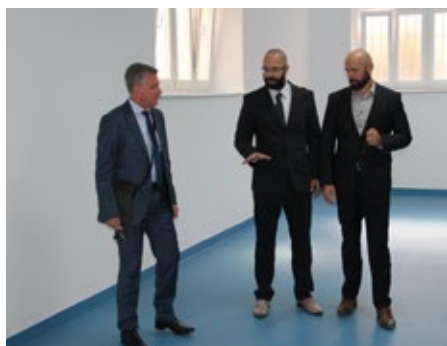
Obnovili smo sportske dvorane Baldekin i Miminac.