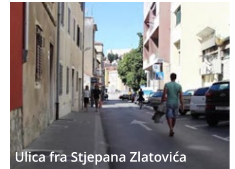
Ulica fra Stjepana Zlatovića