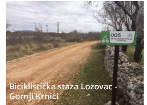
Biciklistička staza Lozovac - Gornji Krnići